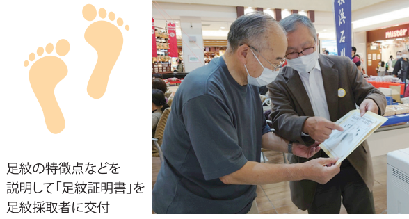
足紋の特徴点などを説明して「足紋証明書」を足紋採取者に交付