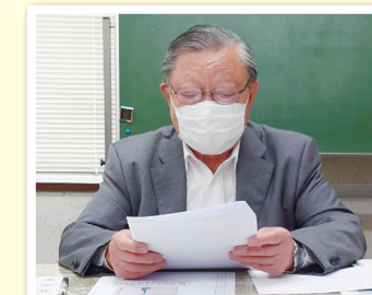
事業報告などの説明をする光眞理事