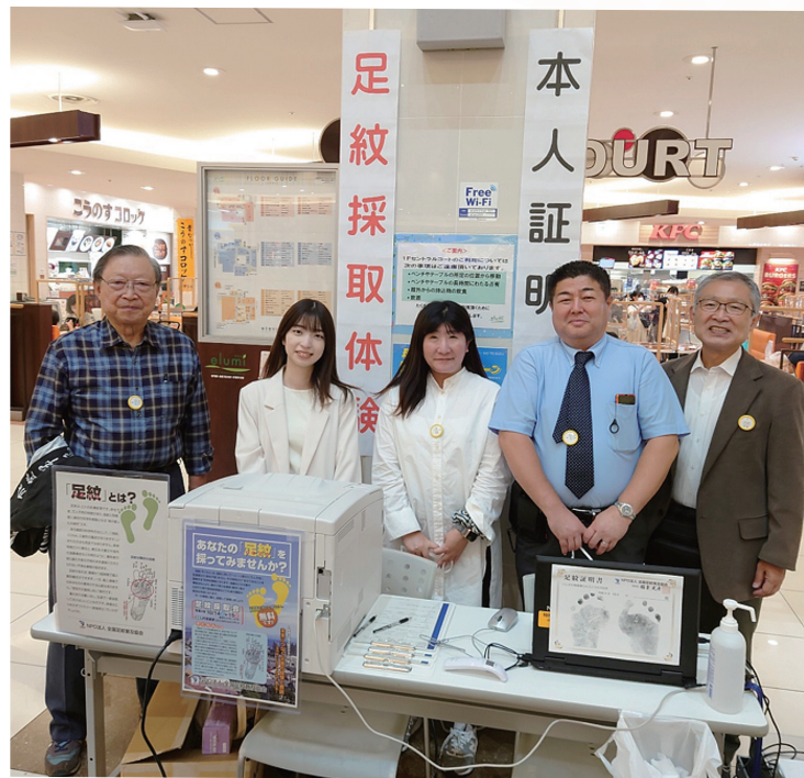
光眞理事(左端)、山本事務局長(右端)とご協力いただいたNEC関連会社の方々