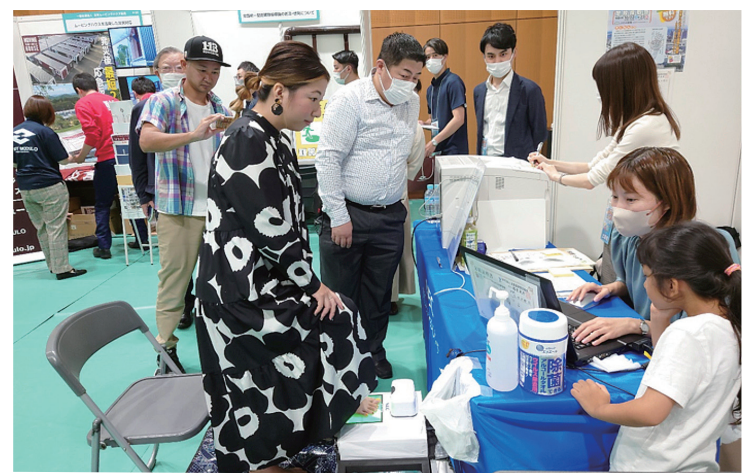
「足紋」を採取している状況(足をスクナーに載せるだけです!)