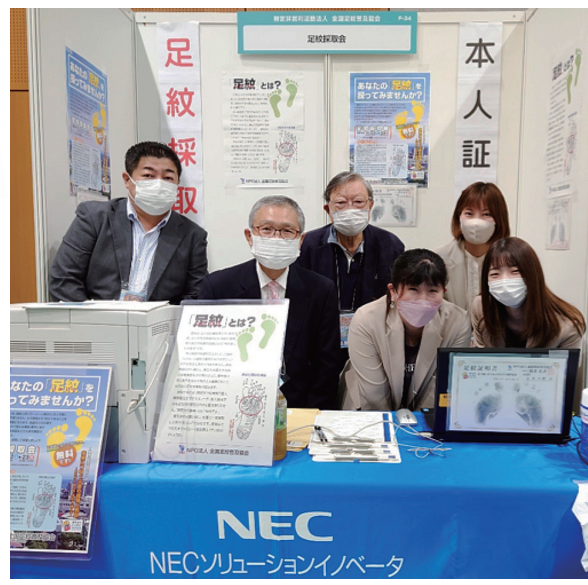
光眞理事(中央)、山本事務局長(同左隣)とご協力いただいたNEC関連会社の方々